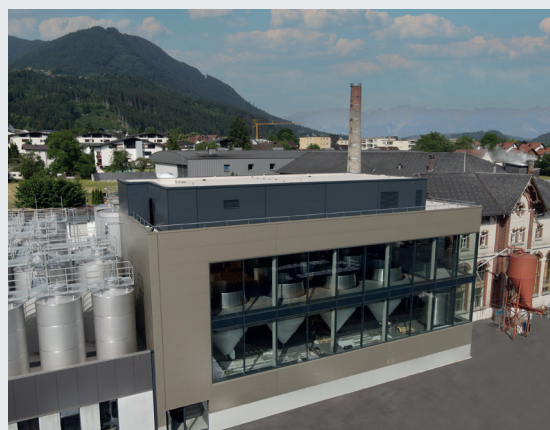
Abbildung 5:

A-6820 Frastanz bier@frastanzer.at www.frastanzer.at