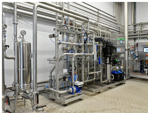
Abbildung 4: Mit wenig Aufwand keimfrei: Um den Arbeitsaufwand und den Chemikalieneinsatz bei der Desinfizierung der Wasseraufbereitung zu minimieren, ließ die Brauerei Frastanz von der Firma Grünbeck eine Anlage zur thermischen Sanitisierung (links im Bild) installieren. Dabei zirkuliert rund 80 °C heißes Wasser durch die Anlage.

Damit bestätigten sich die Erfahrungen, die Schels auch früher schon mit Grünbeck gemacht hatte: „Das kundenorientierte Denken ist bei Grünbeck sehr ausgeprägt. Ich hatte in keiner Minute das Gefühl, dass man dort keine Zeit oder kein Interesse an unseren Anliegen hat – und das über alle Fachabteilungen hinweg. Das ist eine große Stärke.“