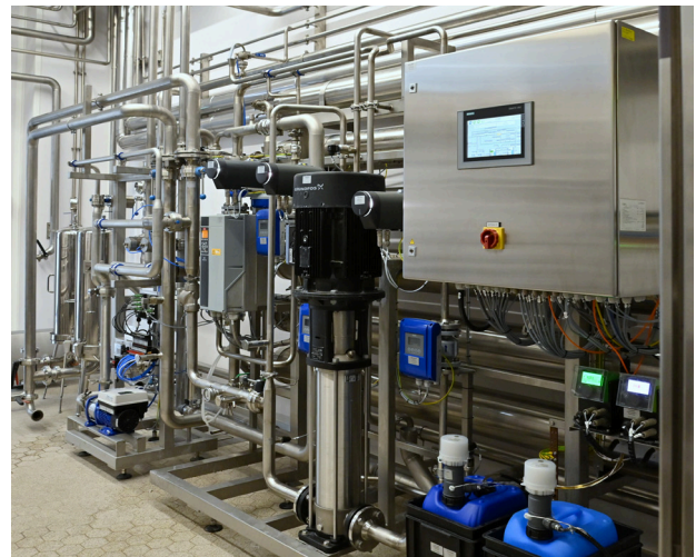
Abbildung 2: Kompakt auf einem Rahmengestell montiert: Die Grünbeck-Wasseraufbereitungsanlage in der Brauerei Frastanz. Ihr Herzstück ist die Umkehrosmoseanlage GENO-OS-MO-RKF 12.500, die pro Stunde bis zu 12,5 m 3 vollentsalztes Wasser liefert, das in der nachgeschalteten Verschnideeinrichtung mit Rohwasser vermischt wird, um die optimale Brauwasserhärte zu erreichen.

„Überzeugt hat uns die Firma Grünbeck neben dem guten Preis-/Leistungsverhältnis vor allem durch die hohe Flexibilität und Kompetenz bei der Anlagenplanung und -konzipierung“, berichtet Schels.